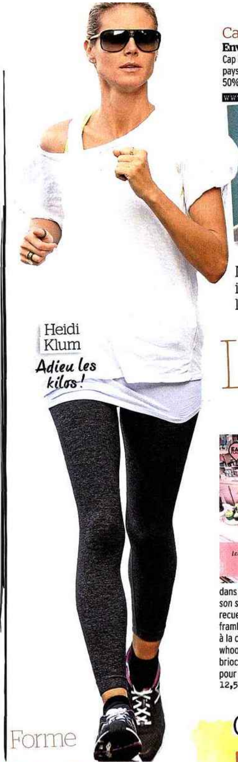
Heidi Klum Adieu les kilos!